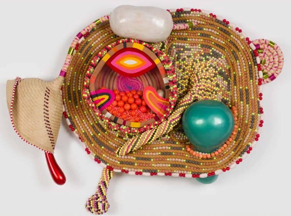
Sem título [Untitled], 2026 (NEP 166)