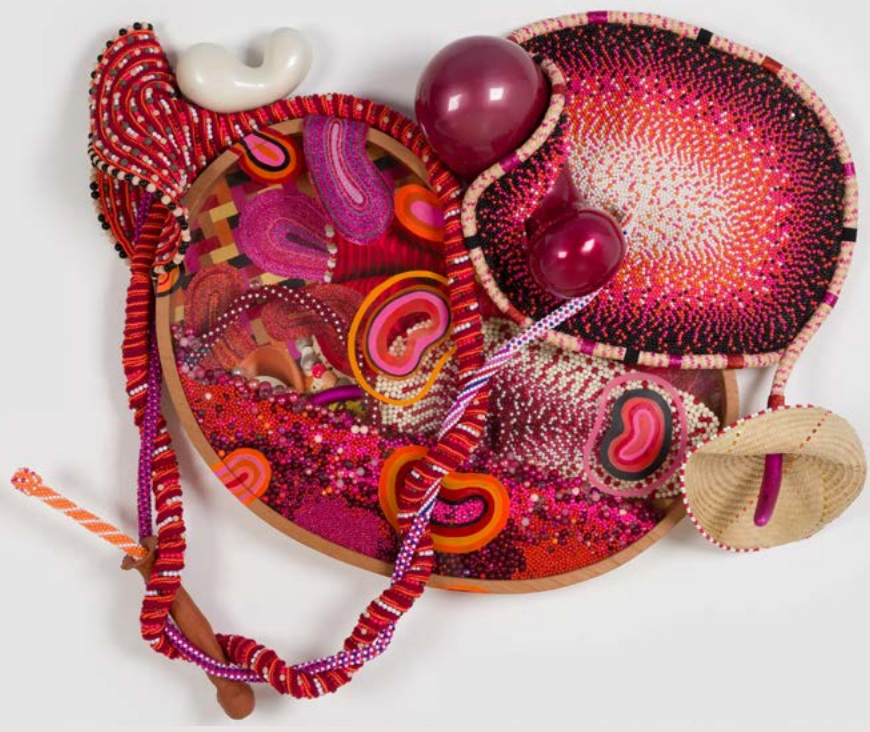
Sem título [Untitled], 2026 (NEP 168)