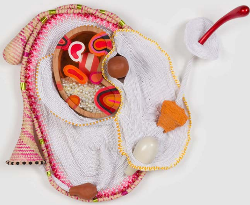
Sem título [Untitled], 2026 (NEP 169)