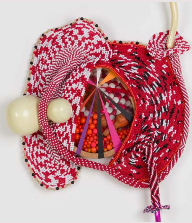
Sem título [Untitled], 2026 (NEP 167)