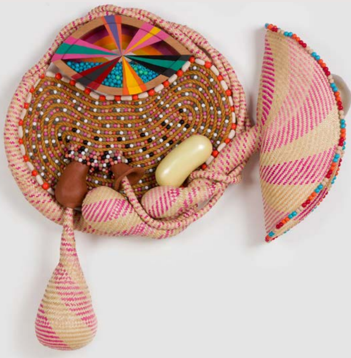
Sem título [Untitled], 2026 (NEP 173)