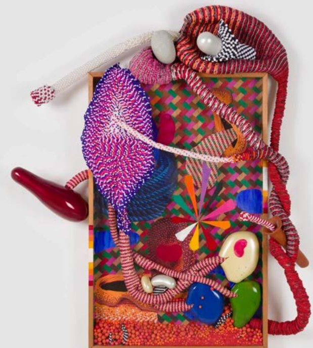
Sem título [Untitled], 2026 (NEP 171)