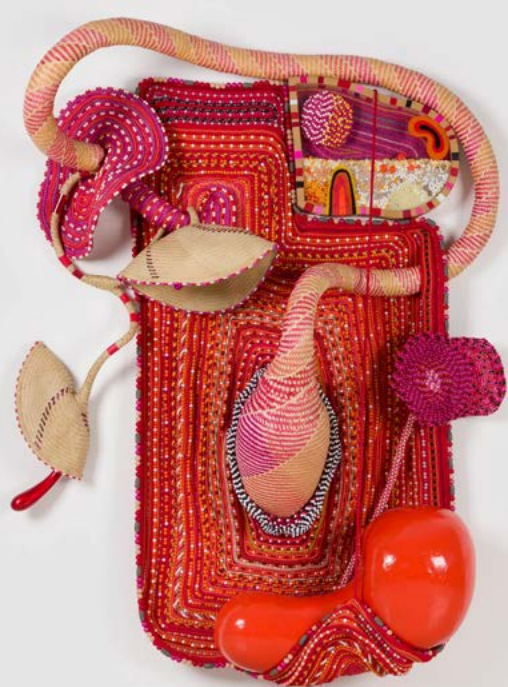
Sem título [Untitled], 2026 (NEP 174)